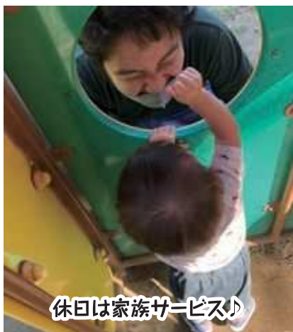
休日は家族サービス♪