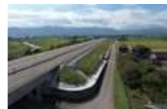
高速道路 4車線化に伴う 工事の 完成状況

主に民間・公共工事の営業や工事の見積書を作成しています。工事部の応援で現場作業をするときもあります。入社1年目は土木工事の専門用語が分からず、困ったときもありましたが、自分で調べたり、上司の方々に教えてもらったりして乗り越えてきました。今では土木関係の資格を取得しました。次は、電気工事関係の資格取得に向けて頑張ります。